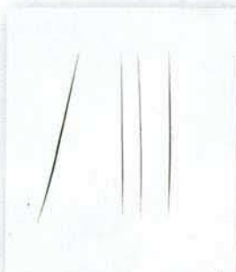
A sinistra: Concetto Spaziale: Attese di Lucio Fontana ('67). A destra: Senza Titolo di Sandro Chia ('81). Sotto: tavolino di Gae Aulenti per Fontana Arte ('80).